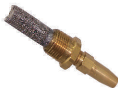
CY38170黄铜嵌体陶瓷切割水针